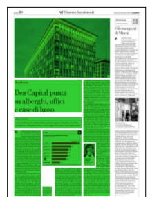
Superficie 72 %