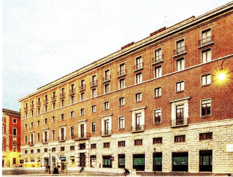
Piazza San Silvestro. L'edificio riqualificato in cui arriverà il Four Seasons

Four Seasons ha aperto il primo hotel nel 1961 e oggi raggruppa nel mondo un portafoglio di 124 alberghi di lusso in destinazioni che vanno dal mare alla montagna alle maggiori città.